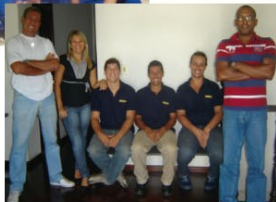
Equipe da Unidade de Macaé, após as apresentações.

A Responsabilidade Ambiental surgiu com a percepção de que os recursos naturais podem se esgotar com a ação predadora do homem. Isso ocorreu quando terríveis acidentes industriais além de deixar doente e até matar populações também degradou os recursos naturais que serviam de insumos para a própria indústria. Com estudos climáticos foi identificado, por exemplo, a nocividade de gases poluentes e seu efeito sob as condições de vida da população. Foi através de um desses estudos que se proibiu a emissão de CFC.