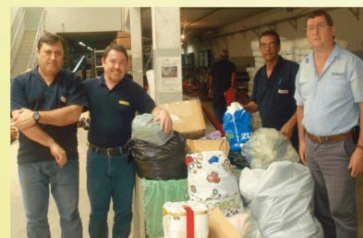
Imagem dos donativos arrecadados pelos colaboradores.

Sempre preocupados com seu papel social, a AFITEMAQ e seus colaboradores arrecadaram doações para as vítimas da tragédia que assolou a região serrana do Rio de Janeiro no início deste ano.