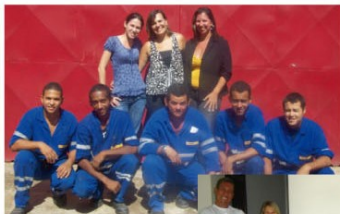
Equipe da Unidade Suape, após as palestras.

O ciclo de palestras do PAS passou pelas Unidades de Suape nos dias 31/01/2011 e 01/02/2011; e Macaé nos dias 14,15 e 16/02/2011.