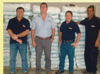
Imagem das fraldas descartáveis doadas pela AFITEMAQ .

"Seja a mudança que você quer ver no mundo". (Dalai Lama)